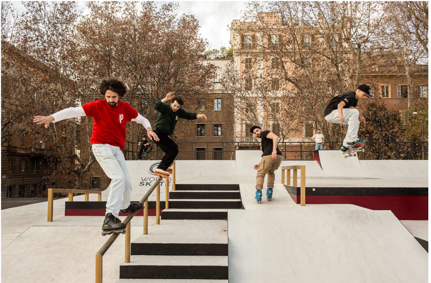
A state-of-the-art park built for a competition last year was left behind for Romans to enjoy.