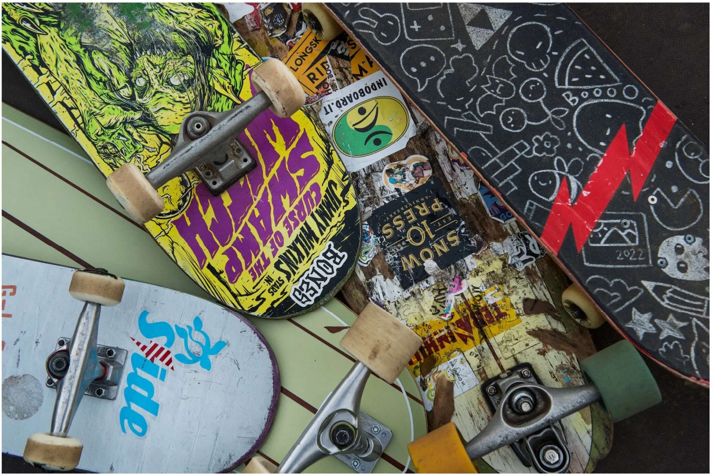
Skateboards at the park.