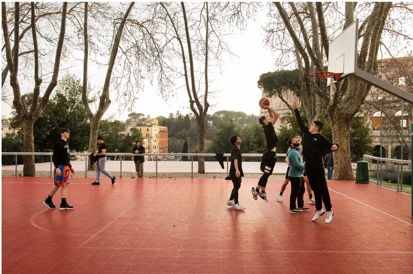
The skatepark is part of a larger playground with a basketball court, and the project will include a small soccer pitch, a volleyball court, fitness machines and an area facing the Colosseum with checker and chess boards.